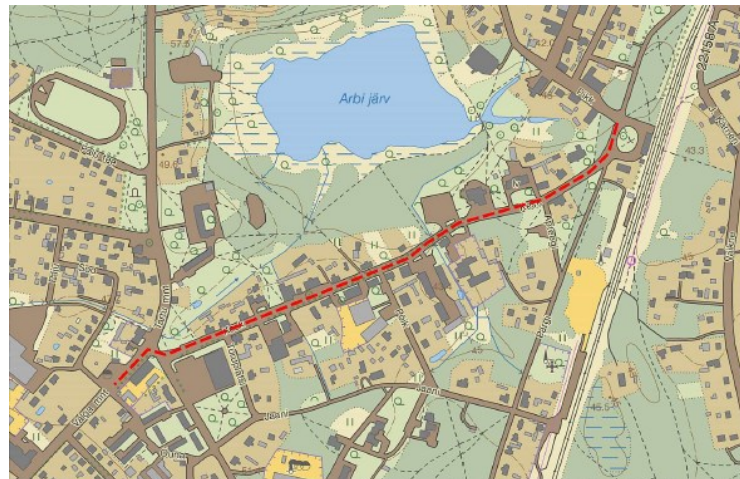
Kaardil on märgitud punasega Elva Kesk tänav.

Projekti arvestuslikuks maksumuseks hindame indikatiivselt 2,2 mln eurot. Projekti omafinantseering puudujäävas osas kaetakse Elva linna poolt võetava pikaajalise laenu abil, mis on planeeritud sisse Elva linna eelarvestrateegiasse 2016-2020. Arvestades linna praegust madalat laenukoormust ja lähtudes linna arengukavast on projekt linnale vajalik ja jõukohane.